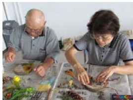
「自然の素材を使ったクラフト」

町内会、PTA 研修会、老人会などで何かしたいんだけど、何をしたらいいのかわからない。やりたいことはあるけど、道具もないし、指導できる人がいない。そんなときは、「交流の家職員による一芸選択プログラム」をご利用ください！交流の家の職員の持ち味を生かしたバラエティー豊かなプログラムを30種類以上の中から選択することができます！！