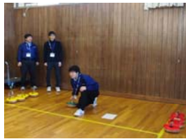
「フロアカーリング」