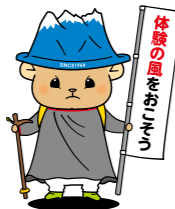
大雪イメージキャラクター「たびうさぎ」

国立大雪青少年交流の家では、みなさまの活動を全力でサポート・コーディネートいたしますので、お気軽にご相談ください。また、「子供の頃の体験は豊かな人生の基盤」となる「体験の風をおこそう」運動、青少年の豊かな感性や表現力を育む「子供の読書活動」を推進しています！