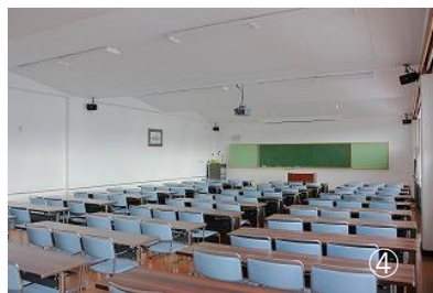
【写真】 ①体育館 ②トレーニングルーム ③温水プール (25m/7コース) ④研修室